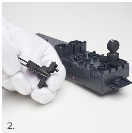
Tady je místo, kam musíte umístit špičku pinzety, abyste předešli poškození spínače nebo zařízení.