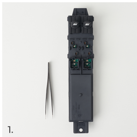
1x špičatá pinzeta