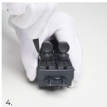
Jemně vypáče spínač pomocí špičky pinzety.