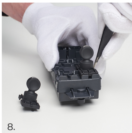
Opět začněte z vnější strany spínače.