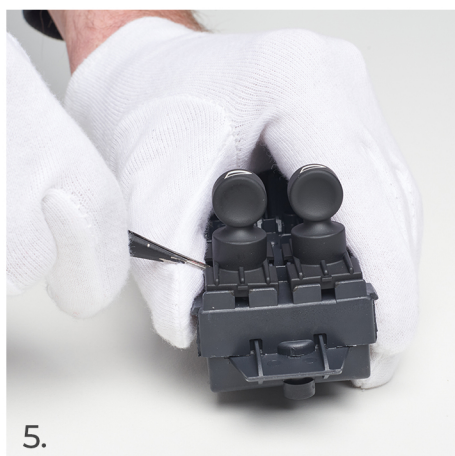
Jemně vypáče spínač pomocí špičky pinzety.