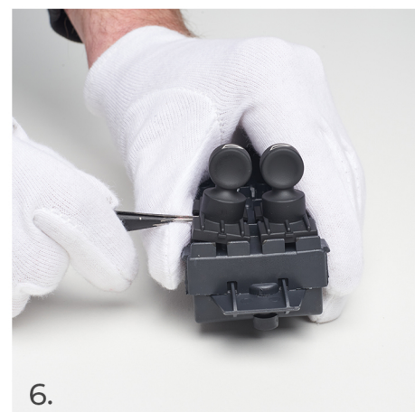
Zastavte v této pozici, když je spínač z vnější strany volný.