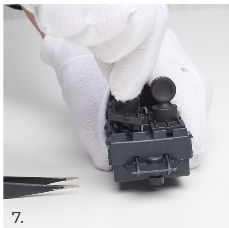
Uchopte spínač a jemně přitáhněte k sobě, abyste jej uvolnili ze zařízení.