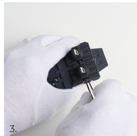
Vždy začněte z vnější strany spínače. Začněte shora a umístěte špičku pinzety do místa zobrazeného na předchozím obrázku.