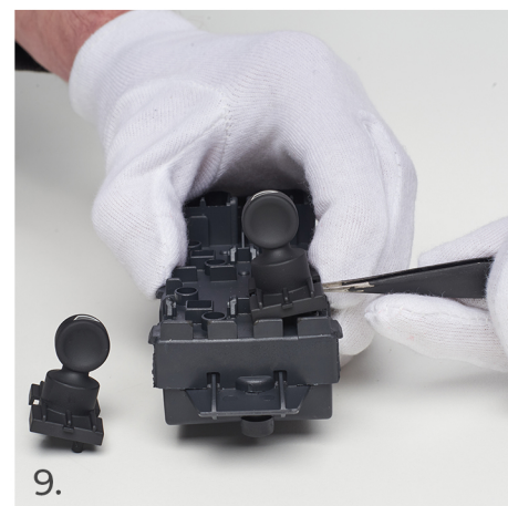
Jemně vypáče spínač pomocí špičky pinzety a pokračujte stejně jako u předešlého spínače.